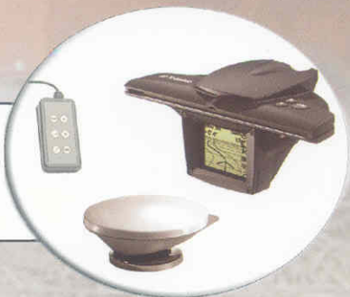
Monitor - configura e ajusta a taxa de aplicação. Sistema de leitura NMEA, na taxa de 4.800 bps.

GPS permite a localização georeferenciada do usuário. Composto por um receptor e barra de luz.