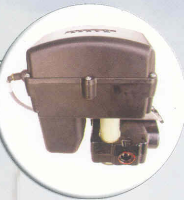
Válvula - controla a vazão de óleo para o motor hidráulico.

Controle de aplicação - permite variar automaticamente ou manual, sua taxa de aplicação, através de mapas de aplicação gravados no cartão de memória.