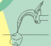
Sistema de segurança acionado

Mola plana - sistema de segurança dos braços, que permite o retorno automático, pela força da gravidade, ou seja, simplesmente levantando o implemento do solo. Permite, também que os braços trabalhem, sempre numa mesma profundidade, devido não sofrer vibrações.