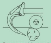
Braço em posição normal