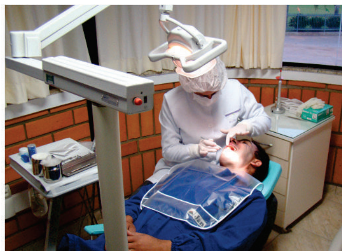
Com os novos consultórios localizados na Unidade IV, houve um aumento de 20% já no primeiro mês de funcionamento.