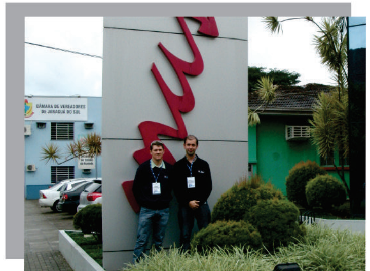
Funcionários realizaram a viagem em junho que durou três dias.