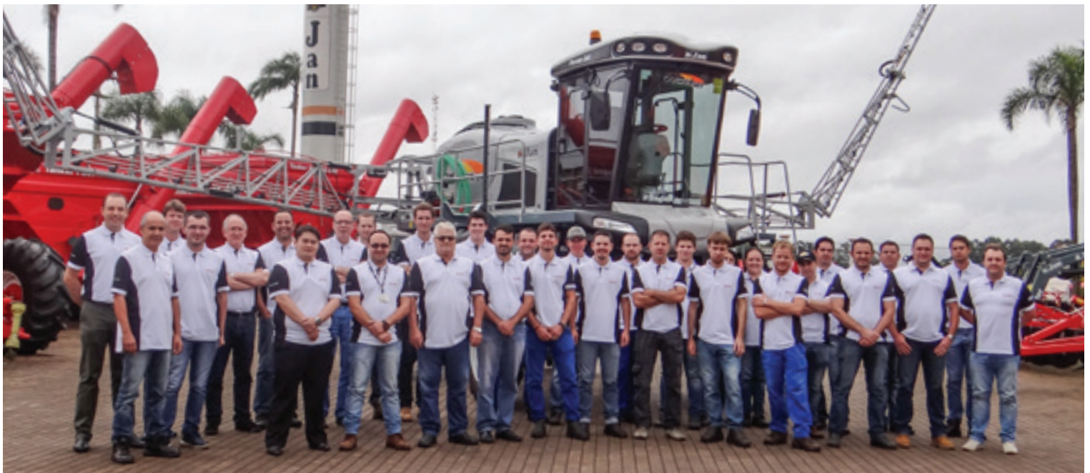
Treinamento em Hidrostática