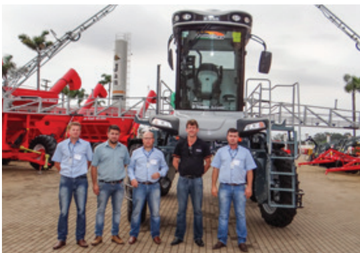
Coopermil – Santa Rosa/RS