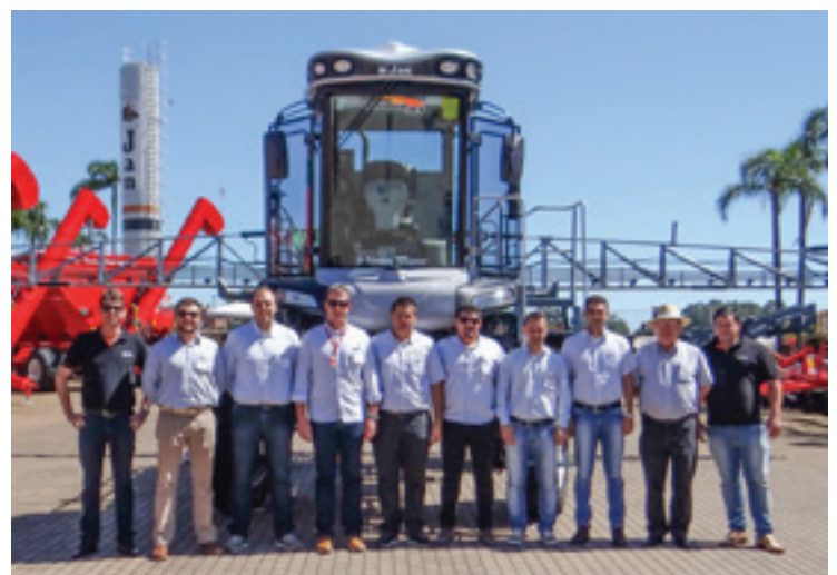
Maquiagro – Lagoa Vermelha/RS