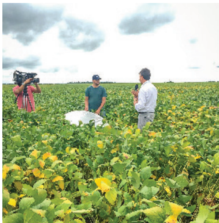
Gravação do Canal Rural