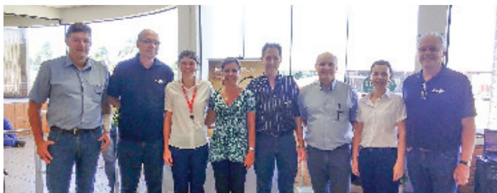
Restaurante Fábrica III Nova - 3 anos