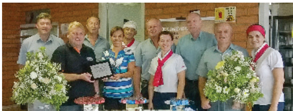
Restaurante Fábrica IV - 5 anos

Oferecer este benefício a seus colaboradores é uma preocupação constante da direção da empresa, que através de iniciativas como esta, se diferencia da grande maioria das empresas.