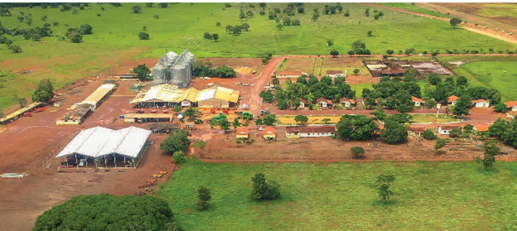
Vista aérea da Agropecuária Jan