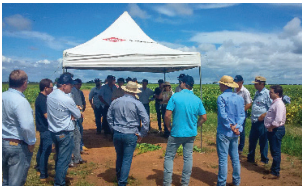
Painel integração lavoura e pecuária

Todo o Dia de Campo da Agropecuária Jan foi transmitido pelo Canal Rural e integrou o Projeto Soja Brasil, que é a maior expedição por lavouras de soja já realizada no país. Com a coordenação técnica da Embrapa, o projeto presta uma consultoria avançada ao produtor brasileiro, que terá acesso a novas dicas e técnicas para obter mais produtividade. Na edição deste ano, o Projeto Soja Brasil também investe em capacitação através da carreta do Canal Rural, que viaja pelos polos produtores para levar conhecimento e promover a troca de experiências entre os agricultores locais.