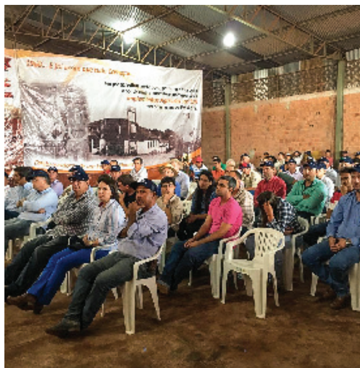
Mais de 200 pessoas participaram