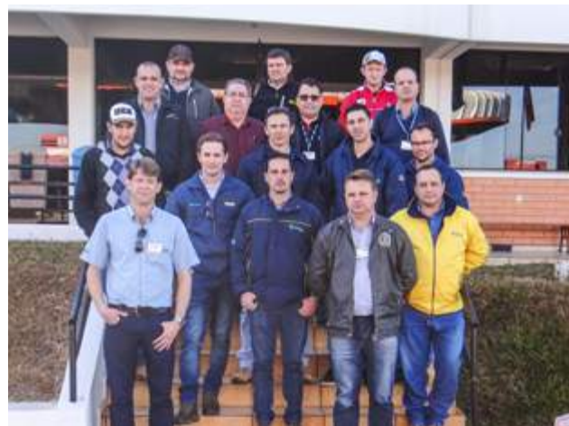
Kesoja – Matriz de Erechim e filiais de Getúlio Vargas, Campinas do Sul, Maximiliano de Almeida, Sananduva, Lagoa Vermelha, Ibiraiaras, Vacaria, Campestre da Serra e Bom Jesus/RS