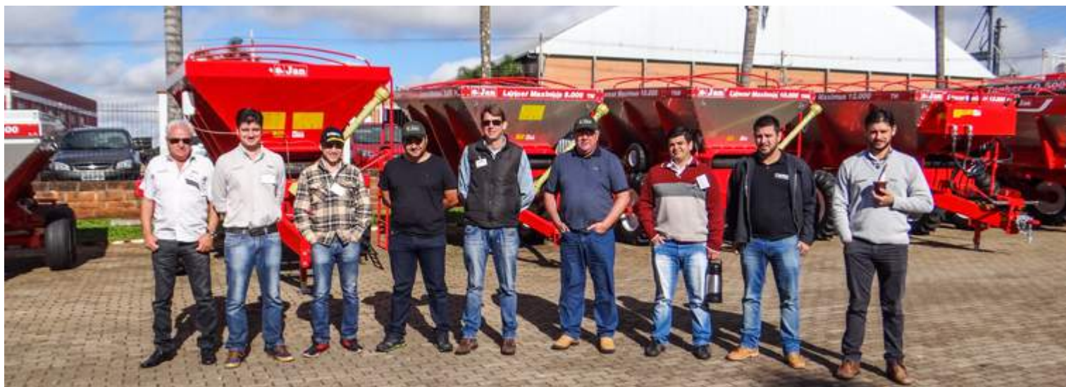
JS Máquinas – Alegrete, Itaqui, São Borja, São Luiz Gonzaga e Uruguai/RS

presentantes das revendas estão munidos de informações mais detalhadas para passar aos seus clientes que irão adquirir os implementos fabricados pela Jan, afim de facilitar o seu dia a dia no campo. Realizaram visita técnica nos últimos meses deste ano: