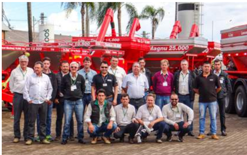
Plantare – Estrela, Vacaria, Lagoa Vermelha, Caxias do Sul e Montenegro/RS