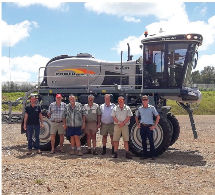
Comitiva da África do Sul – março de 2017

Vêm obtendo resultados bastante satisfatórios as visitas técnicas e os treinamentos realizados pela Jan. Através deles é possível esclarecer as dúvidas, apresentar o processo de fabricação, demonstrar a tecnologia existente em cada parte da máquina e a sólida estrutura que está por trás dos implementos que ajudam a transformar o agronegócio brasileiro e mundial.