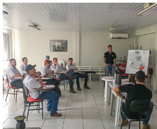
Revenda Augustin Guarapuava/PR