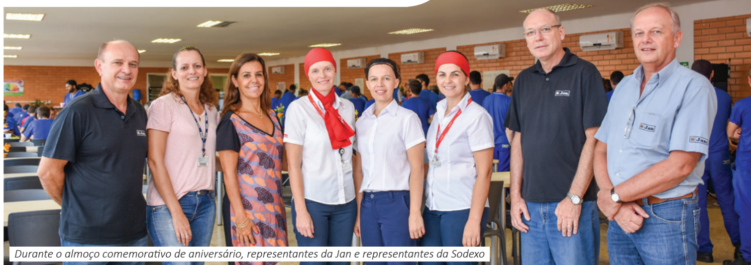
Durante o almoço comemorativo de aniversário, representantes da Jan e representantes da Sodexo