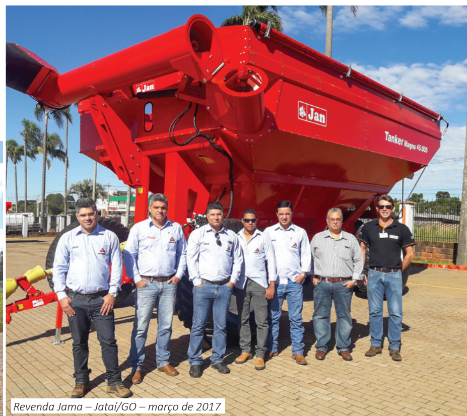
Revenda Jama – Jataí/GO – março de 2017

Neste início de 2017, foram realizados alguns encontros com as comitivas vindas do exterior. Destaque para os países africanos, grandes consumidores em potencial.