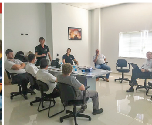
Revenda Augustin Mangueirinha/PR