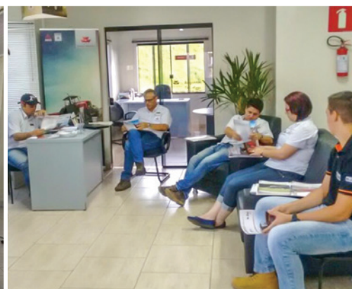
Revenda Augustin União da Vitória/PR