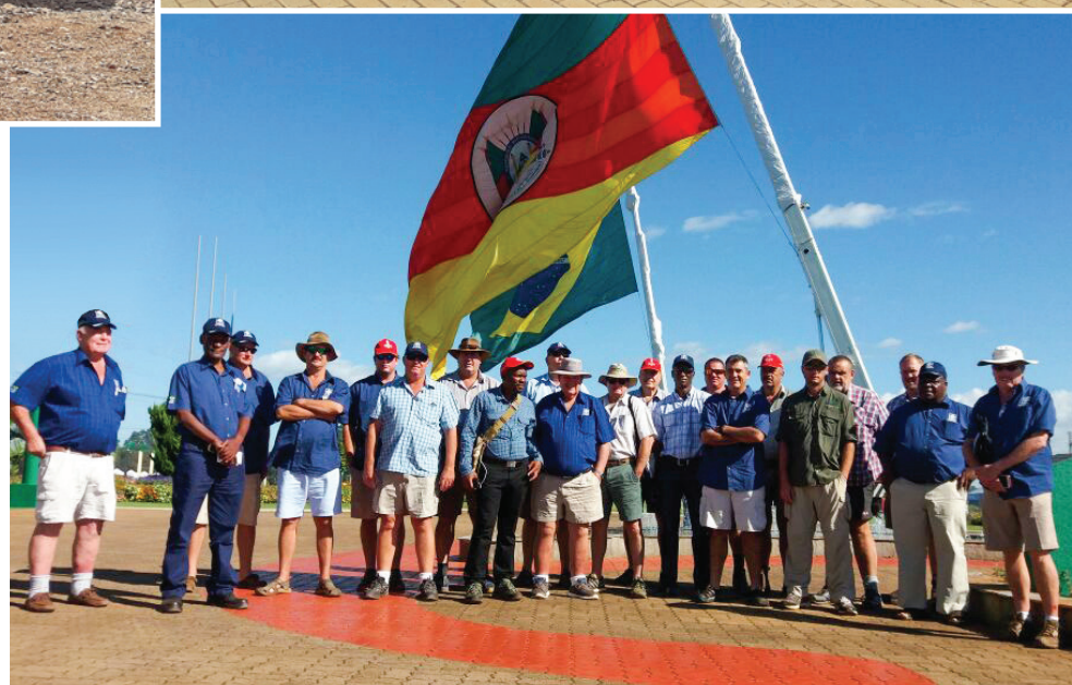
Comitiva do Zimbábue – março de 2017

Neste início de 2017, foram realizados alguns encontros com as comitivas vindas do exterior. Destaque para os países africanos, grandes consumidores em potencial.